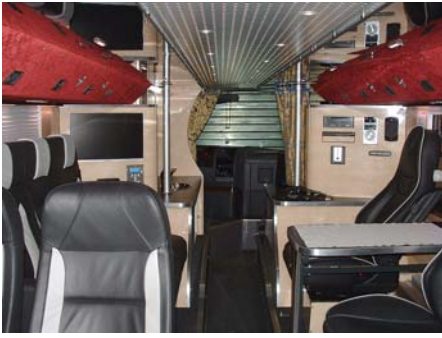
Eine Anmutung wie im Luxus-Hotel: In einem solchen Bus lässt sich reisen

So sind die grauen Busse aus Wehnrath bei allen großen kontinentaler Musik-Events zu sehen – von Glasgow bis zum Nordkap und von Lissabon bis Moskau. Neben Erfahrung und gründlicher Vorbereitung sind die Fahrer der