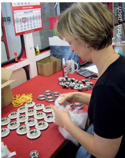
Montage in Waldbröl